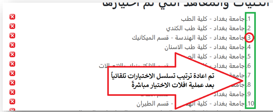
الشكل رقم (١١)

وبعد تحديد كل الاختيارات الصحيحة وبدون اي أخطاء يمكن معاينة هذه الاختيارات مباشرةً بالضغط على صفحة (معاينة الاختيارات والخزن) الموجودة في اعلى الصفحة.