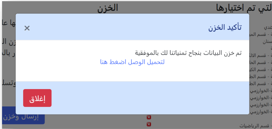
الشكل رقم (١٤)

في حال نجاح الحزن ستظهر لك الرسالة الموضحة في الشكل رقم (١٤) لتمكنك من سحب الوصل الخاص بك والمثبت فيه اختياراتك المخزونة.