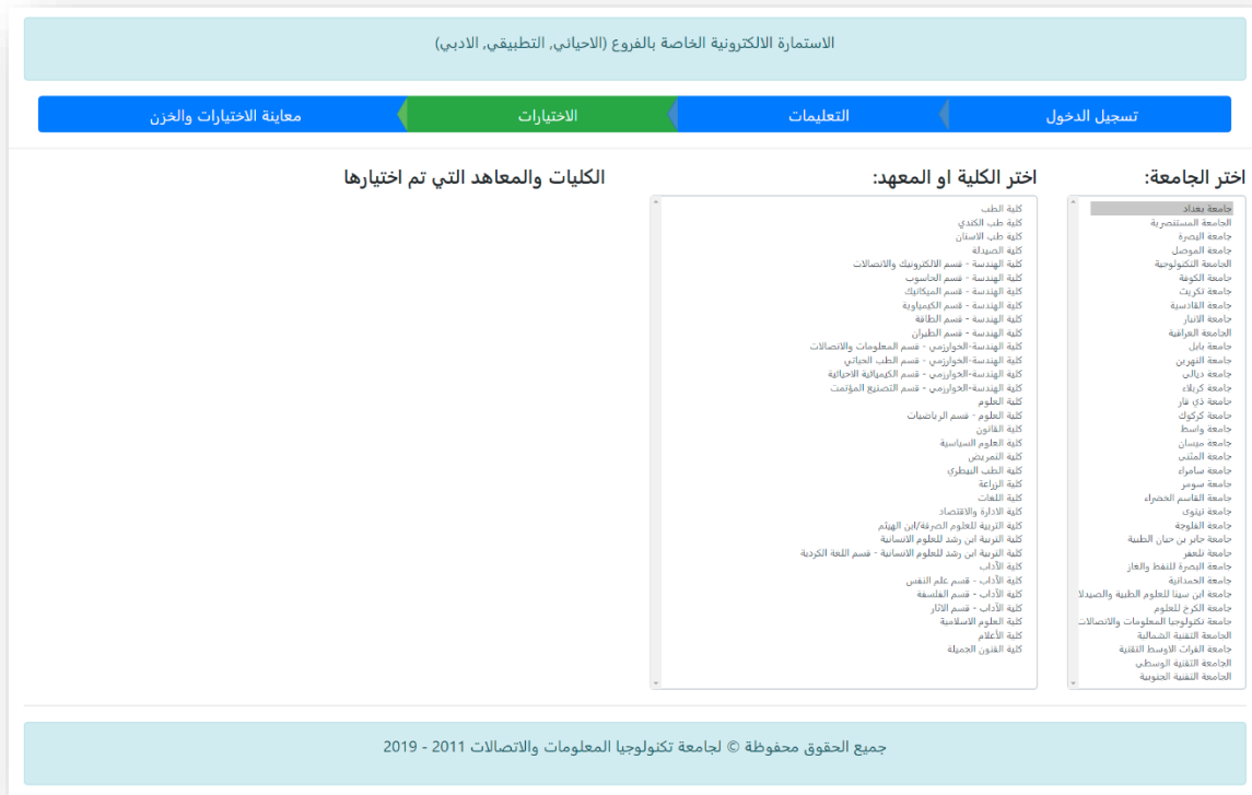
الشكل رقم (٧) الصفحة الخاصة بتحديد الاختيارات

وبعد الضغط على زر (الاختيارات) من شريط مراحل الملء سوف تظهر الصفحة الخاصة بتحديد الاختيارات كما في الشكل رقم (٧).