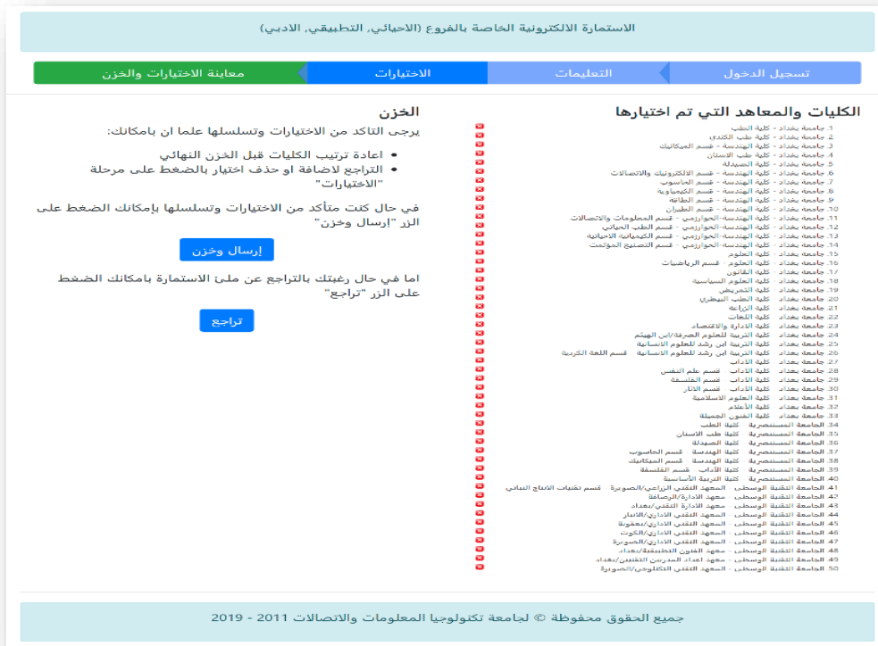
الشكل رقم (١٢)